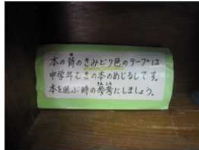
【本の対象学年色分けのサイン】