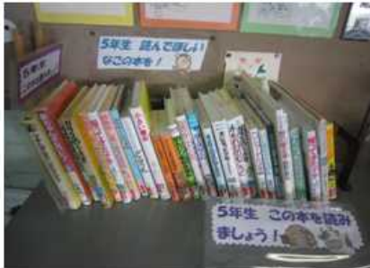
【学年別オススメの本】