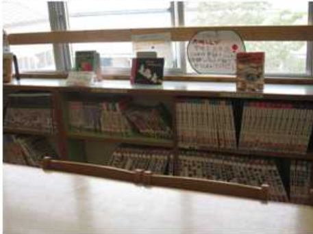
【図書委員さんオススメの本】