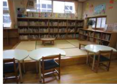
【くつろぎコーナー】