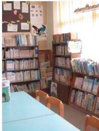
【廃棄中(コーナー資料)】