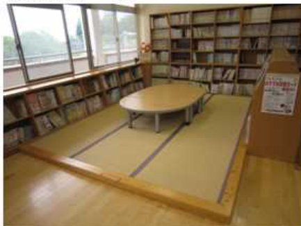
【くつろぎスペース】