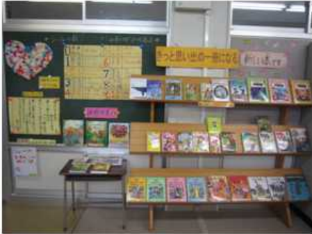
【課題図書・新刊展示】