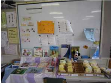
【「6月の本」をテーマにした展示】