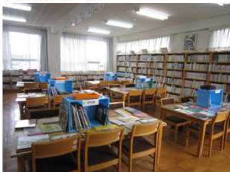
【ヨムヨム 世界一周】