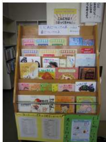
【「いじめ・歯」をテーマにした展示】