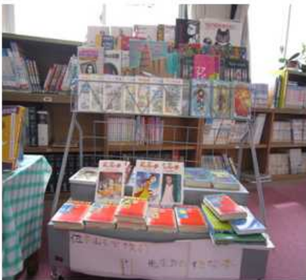
【展示コーナー：先生方おすすめの本】