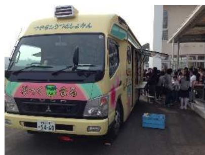
【自動車文庫「ぶっくまる」】