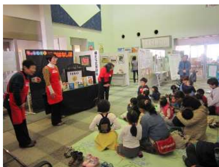
【勝北図書館での読み聞かせ】