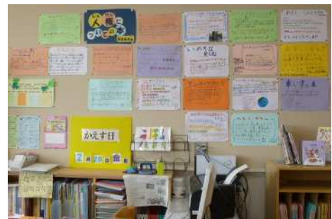
【高野小学校図書委員おすすめコーナー】