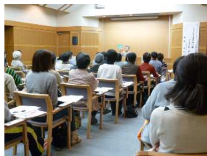
【読書ボランティア研修会】