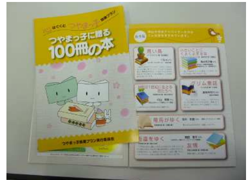
【「つやまっ子に贈る100冊の本」】