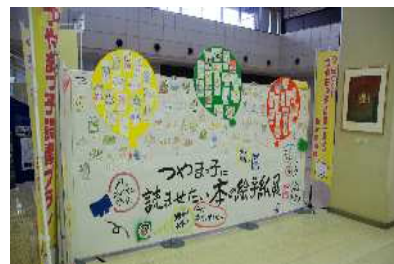
【つやまっ子に読ませたい本の絵手紙展】

その中では、子どもにとって最も身近な家庭で読み聞かせを行うことの重要性とともに、読み聞かせ本の紹介などを通じて保護者への啓発と支援を行います。さらに、それぞれの子どもの発達段階に応じた適切な読書活動を進めるため、地域をあげて大人自らが読書に親しむ雰囲気づくりと、子どもを支援する体制づくりに果たす読書ボランティアの重要性などについても、地域の人々に理解と関心を深めてもらえるよう啓発に努めます。