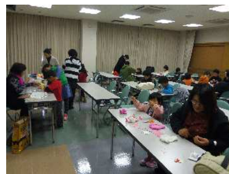
【加茂町図書館での粘土教室】