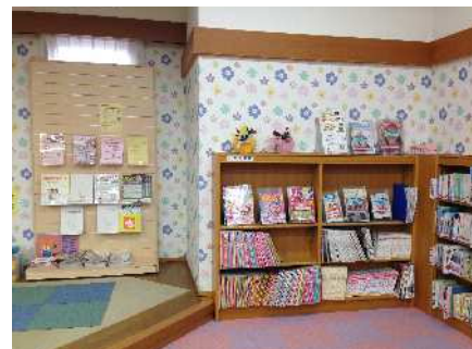
【子育て支援コーナー】