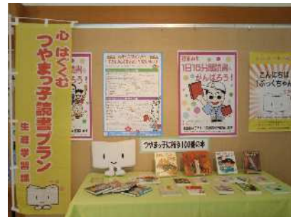
【こどもの読書週間パネル展】

津山市では、読書活動の意義や重要性について、子どもだけでなく保護者や関係者、そして地域の多くの人々に様々な機会をとらえて啓発するため、「子ども読書の日」や読書週間にちなんだ取り組みを進めるとともに、市立図書館の活動や「子ども読書の日」の行事などを「広報つやま」やホームページなどでも紹介し、積極的に広報し、啓発を図ります。