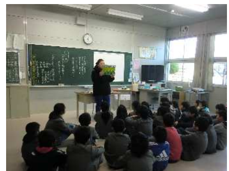
【院庄小学校での読み聞かせ】