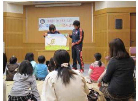
【岡山湯郷 Belle 選手による読み聞かせ】