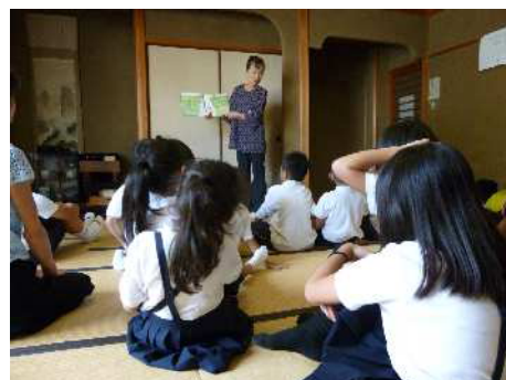
【放課後子ども教室での読み聞かせ】

今後、家庭での読書活動推進と併せ、地域をあげて子どもが本とふれあうことのできる体制づくりをより進めるため、地域の拠点施設での読書ボランティアの積極的な活用や、地域の協力による読書活動をより進めます。