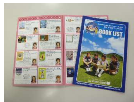
【「岡山湯郷 Belle 選手・監督がつやまっ子に贈るおすすめ本ブックリスト」】