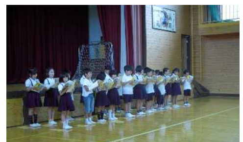
【中正小学校音読大会】