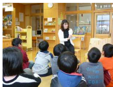
【東小学校図書館司書による読み聞かせ】

そして、これらをより進めるために、保育所(園)・幼稚園等の職員及び、学校に配置されている学校司書(または図書整理員)、司書教諭等は、市立図書館と連携し、所(園)・校内の読書環境や図書資料などの充実を図ります。