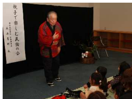
【久米図書館での民話の語り】