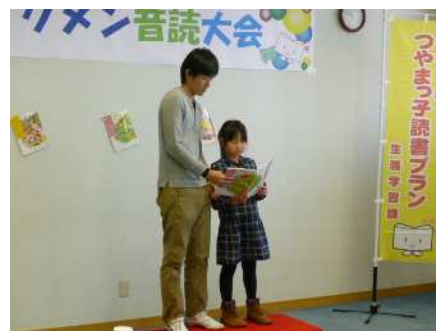
【イクメン音読大会】

更に、子どもが日常生活の中で自然に読書に親しむために、ゲームや携帯電話など様々なメディアとの付き合い方を見直し、基本的な生活習慣を整えるなど読書活動推進につながる家庭での環境づくりの支援を推進していきます。