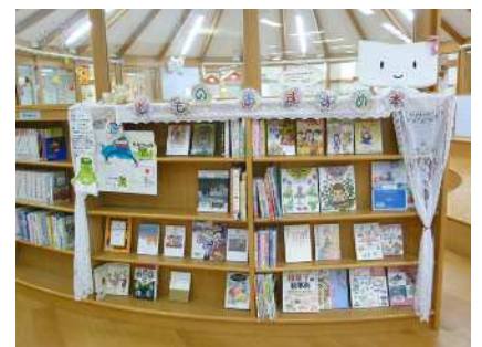
【おすすめ本コーナー】