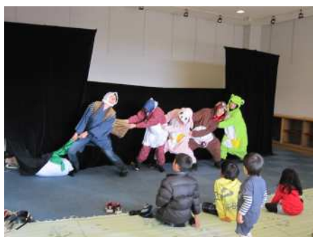
【久米図書館での劇】